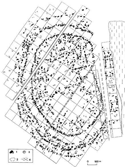
План трипільського поселення біля с. Майданецьке

Навпроти єдиного округлого вікна, яке звичайно робили у протилежній до входу стіні, зводили глиняний жертвник — у плані округлий або хрестоподібний . Вівтар фарбували в червоний колір та прикрашали ритим спіральним орнаментом. Загальна площа трипільських жител становила від 60—100 до 200—300 кв. м. Крім жител, відомі також, повторимо, храми та інші громадські споруди.