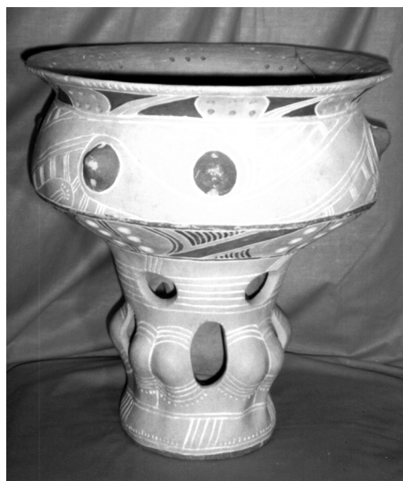
Трипільська кераміка (реконструкція). Студія трипільської кераміки, Київ, школа № 66

Коли шукають корені народів, які жили на землях України, так чи інакше звертаються до Трипільської цивілізації. Трипілля — це перший хліб, перший метал, початок планетарного землеробського світогляду на теренах, які нині називаються Україною. Творці Трипілля стояли біля витоків цивілізації Європи і зробили дуже вагомий внесок у формування сучасної культури України.